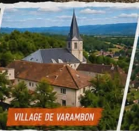
VILLAGE DE VARAMBON