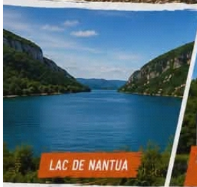
LAC DE NANTUA