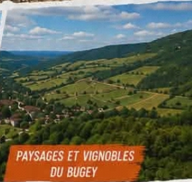
PAYSAGES ET VIGNOBLES DU BUGÉY