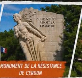
MONUMENT DE LA RÉSISTANCE DE CERDON